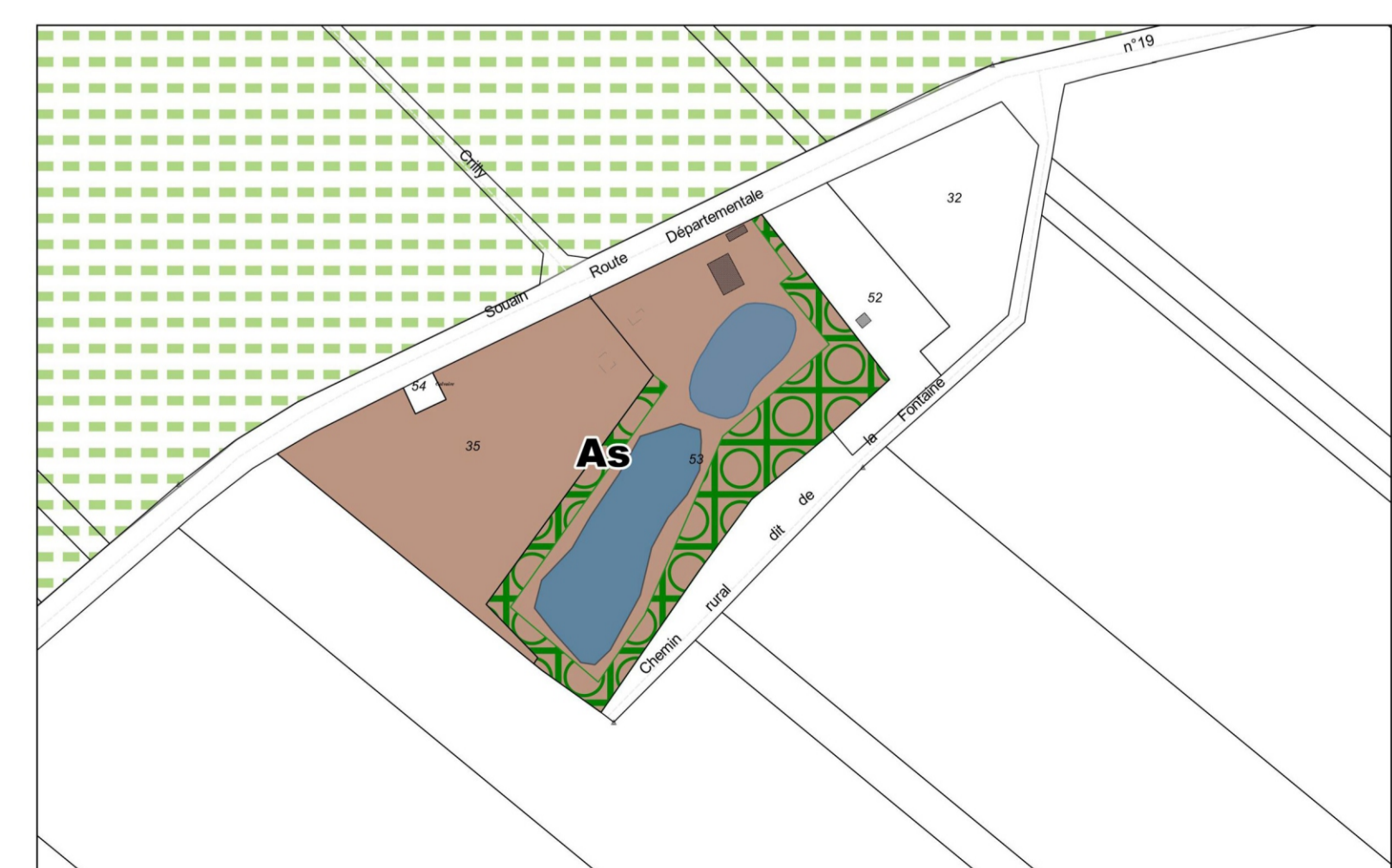
Zoom sur le STECAL au 1/2000ème